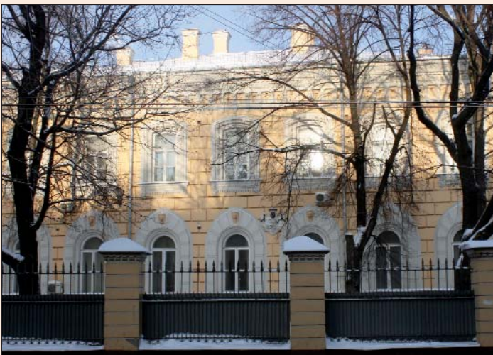
Москва, Большая Никитская, 42. Фото 2010 г.