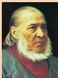
С. Т. Аксаков

родного творчества, раннему знакомству с лучшими произведениями мировой литературы. Об этом вспоминали С. Т. Аксаков, А. И. Герцен, М. Горький, А. Н. Толстой, К. Паустовский, С. Маршак, К. Чуковский и многие другие.