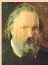
А. И. Герцен