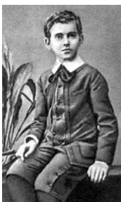
Януш Корчак в возрасте короля Матиуша

Говорят, что три самых гуманных, самых благородных профессии на земле, — это врач, учитель и детский писатель. Генрих Гольдшмидт (1878—1942) был врачом-педиатром, педагогом-директором «Дома сирот» (детского дома, по-нашему) и детским писателем. Он писал под псевдонимом Януш Корчак, и это имя стало символом беззаветного служения детям.