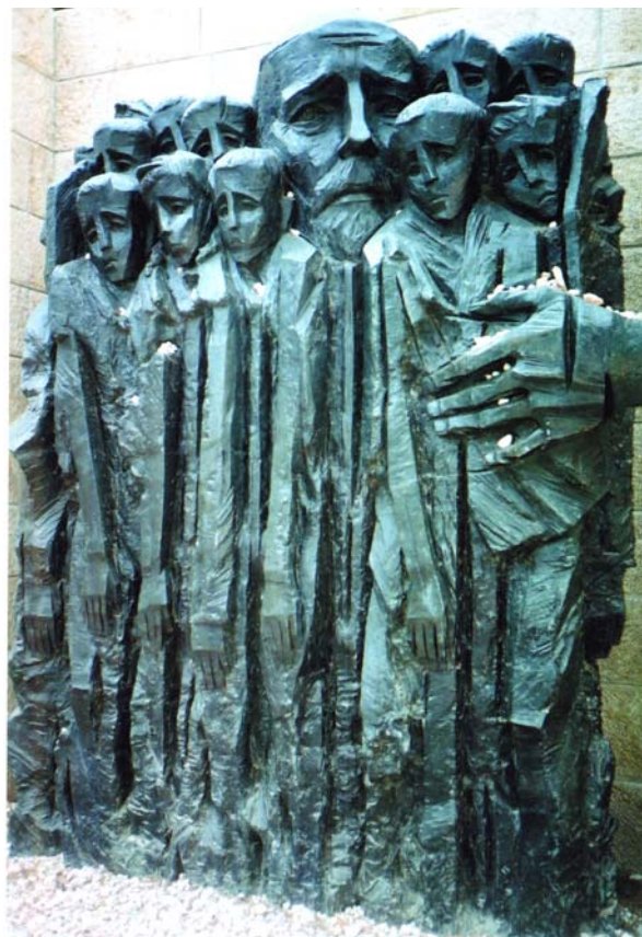
Памятник Янушу Корчаку и его воспитанникам около иерусалимского мемориала памяти жертвам фашизма Яд-Вашем.

Ещё в студенческие годы он начинает журналистскую и писательскую деятельность. Корчак неоднократно подчёркивал, что талант его формировался под влиянием великой русской литературы девятнадцатого века, особенно любил он творчество А.П. Чехова.