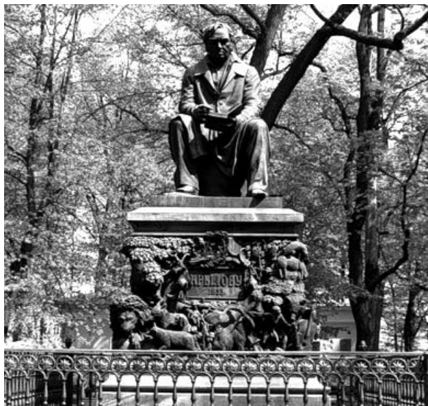
Памятник И.А. Крылову. Летний сад, С.-Пбг. Скульптор П.К. Клодт.

Ступень обучения: начальная школа, выпускной класс.