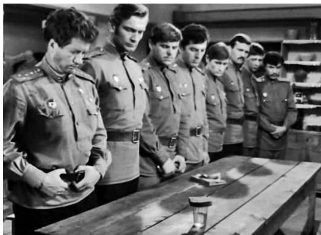
Кадр из фильма «В бой идут одни старики»