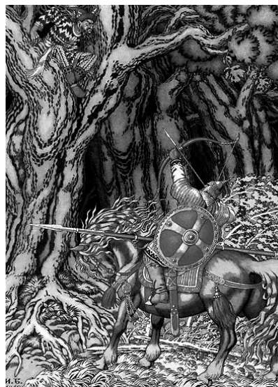
Илья Муромец и Соловей-разбойник. Худож. И. Билибин