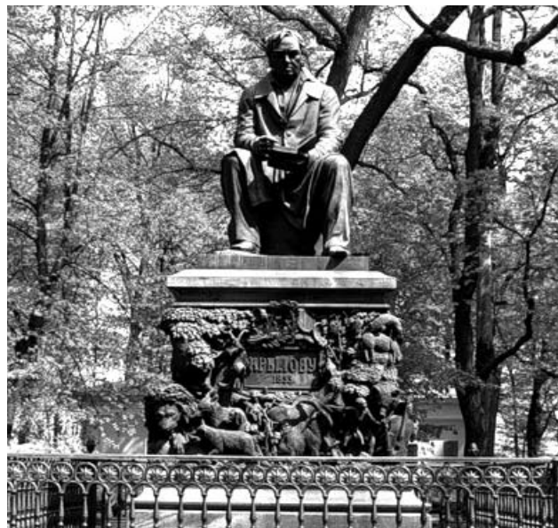
Памятник И.А. Крылову. Летний сад, С.-Пбг. Скульптор П.К. Клодт.

Ступень обучения: начальная школа, выпускной класс.